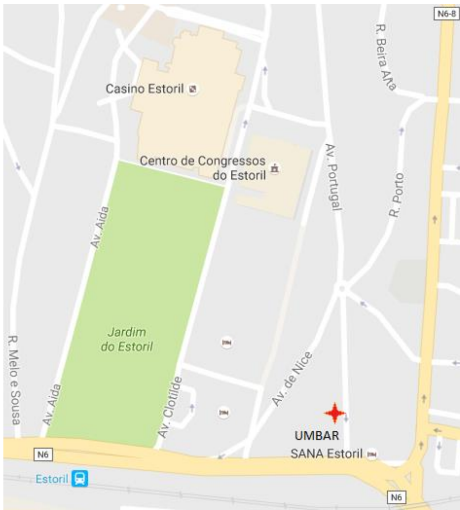
Fig. 1 - UMBAR Estoril : Rua Biarritz nº 3 – loja E, 2765-200 Estoril, Cascais

Situado no Estoril, a 500m do Casino Estoril, da discoteca JezzBel e do Tamariz Beach Club.